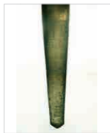
ファイバーポスト