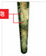
ファイバーポスト