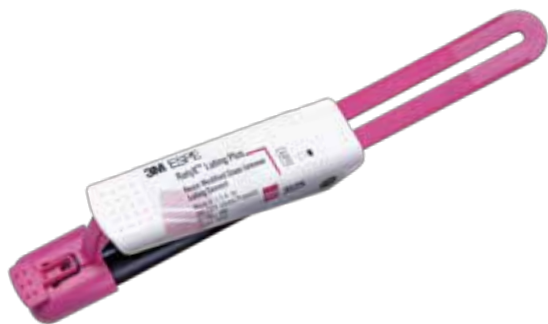
リライエックス™ ルーティング プラス

今回のキャンペーンでは、リライエックス™ ルーティング プラスを収納する専用ケースを組み合わせてご提供いたします。