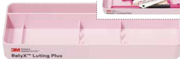
リライエックス™ ルーティング プラス 専用ケース