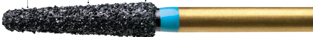
プレデタージルコニア Z856-018M