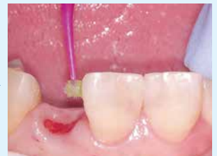
④ 口腔内被着面にボンドマー ライトレスII塗布