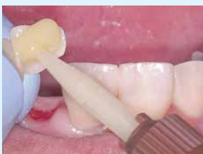
⑤ 補綴物側にエステセムIIペースト塗布