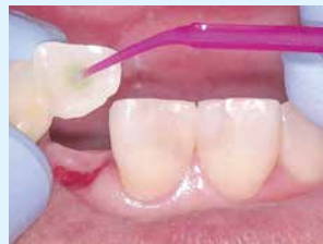
③ 補綴物にボンドマー ライトレスII塗布、エアブロー