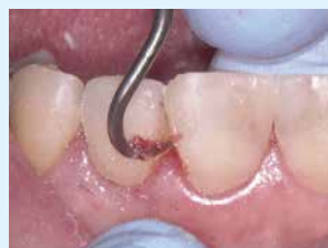
⑦ 余剰セメント除去