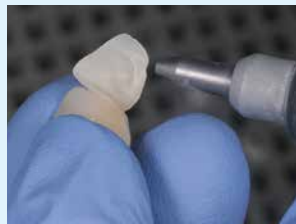
② サンドブラスト処理