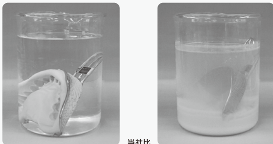
ニシカトレクリーナーよくとれ〜る