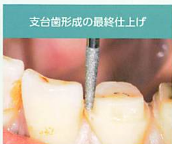
支台歯形成の最終仕上げ