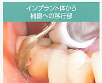
インプラント体から 補綴への移行部