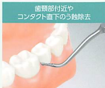
歯頸部付近や コンタクト直下のう蝕除去