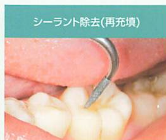
シーラント除去(再充填)